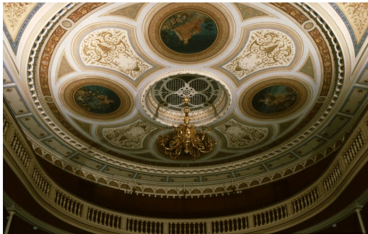
Ystads Teater, salongens tak.