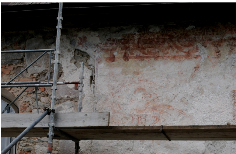
Alvesta kyrka. Långhusets sydsida. Parti med bl.a. fragment av en ängel.