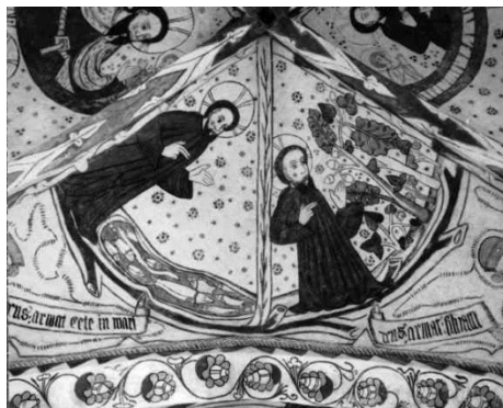
Gladsax kyrka, Detalj från östra långhusvalvet.