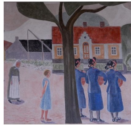
Detalj efter restaurering.