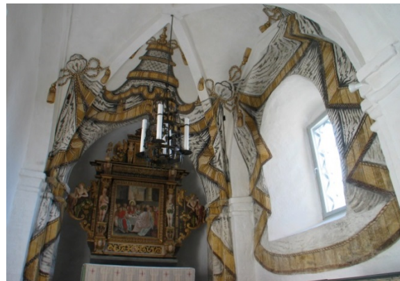
Hannas kyrka. Korets draperimålning.