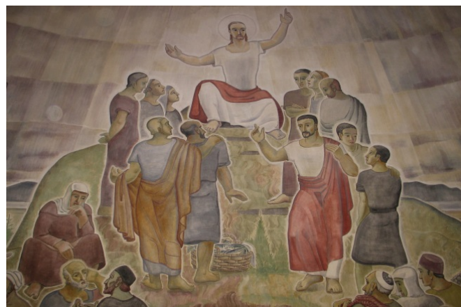
Grevie kyrka. Detalj av altarmålningen.

Konsivering av altarmålning av Pär Siegård. I frescoteknik från 1937.