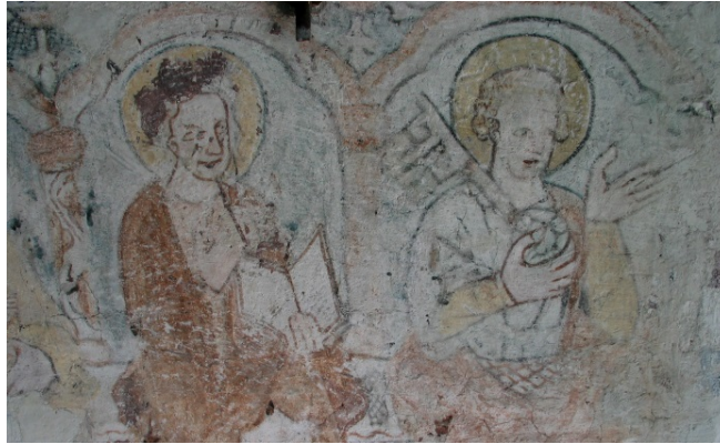
Norra Strö kyrka. Detalj av absiden.