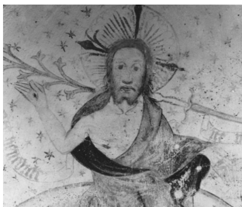
Rörby kyrka. Detalj av västra valvets östra valvkappa.