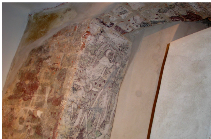
Wanås. Detalj av Korsfästelsen under konservering.

Friläggning och konservering av sengotiska kalkmålningar med bibliska motiv från ca 1475-1525.