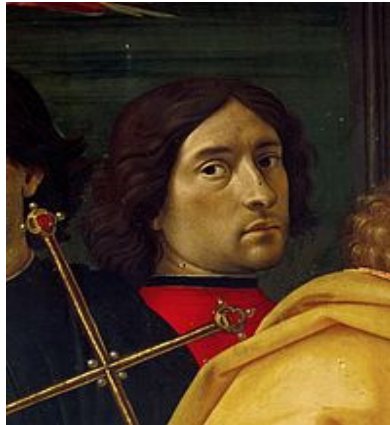
Domenico Ghirlandaio: Själporträtt i temperamålning, Konungarnas tillbedjan 1485-1488. I Spedale degli Innocenti, Florens.

Målningsfragmenten tillhör Lunds Universitets konstsamling.