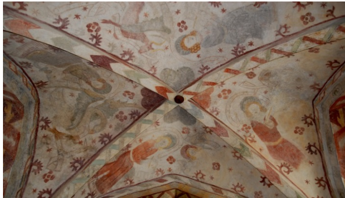
Gustav Adolfs kyrka, korvalvet.