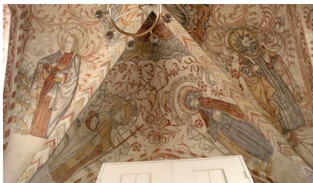
Östra Hoby kyrka. Målningar av Åleverkstaden i korvalvet.

1990 Östra Hoby kyrka Konservering av målningar från två perioder , Fjälkingegruppen 1430-60 och Åleverkstaden 1500-1515. Målningar i fyra valv.