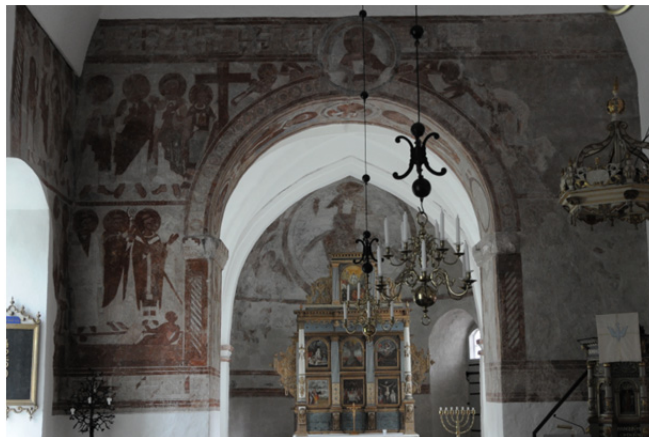
Finja kyrka. Vy mot triumfvägg och absid.

Konserveringsteknisk förundersökning av romanska målningar från 1125-1150. Samarbete med bl.a. Nationalmuseet i Danmark.