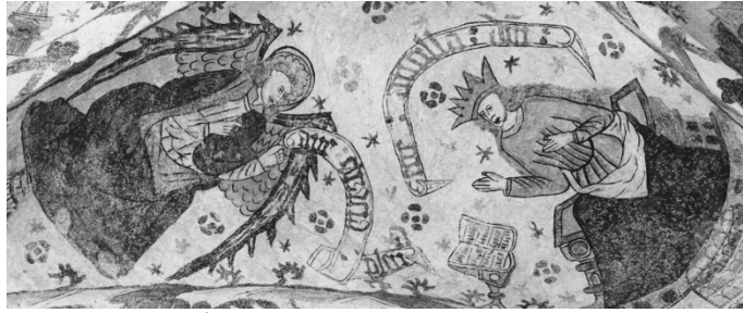
Hästveda kyrka. Bebådelsen i korvalvet.