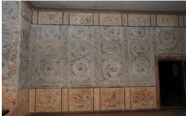
Kalmar slott, Landshövdingekammaren