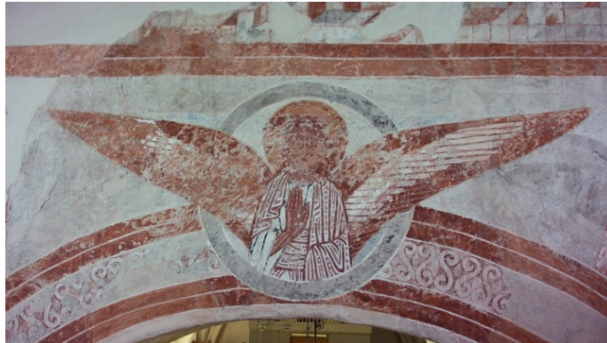
Lyngsjö kyrka. Detalj av korets västvägg.

Konsivering av romanska målningar 1125-50. Målningar med hög grad av autenticitet i kor och triumfbåge.