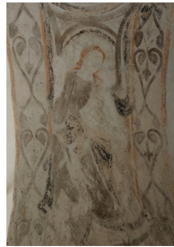
Detalj av triumfbågens målningar.