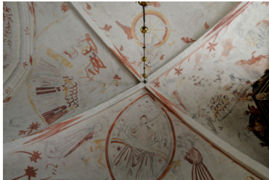
Gualövs kyrka. Östra långhusvalvet.

Konserveringsteknisk förundersökning av målningar tillhörande Fjälkingegruppen.