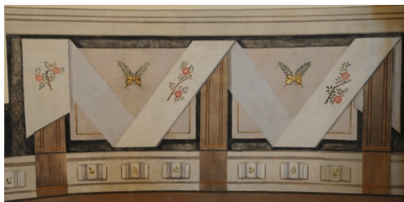
Ljungby kyrka. Detalj av korets bröstning.