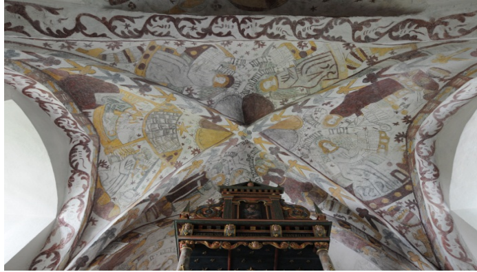
Farstorps kyrka, korvalvet.

Konsivering av målningar i absid, kor, triumf- och tornbåge.