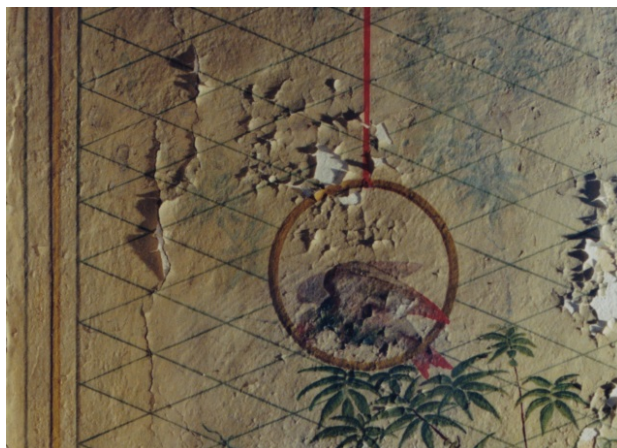
Hovdala. Detalj av Vita salens målningar före konservering.

Konservering av dekorationsmåleri i oljeteknik på puts i Vita Salen. Från 1800-talets mitt. Uppdragsgivare Statens Fastighetsverk.