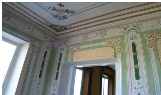
Hörby gård, Mjällby. Detalj av Gröna salen. Genom dörröppningen skymtar Stora salens dekoration.

Konsivering och restaurering av ornamentala och figurativa dekorationsmålningar från 1800-talets mitt i två salar. Gården blev Statligt Byggnadsminne i samband med restaureringen.