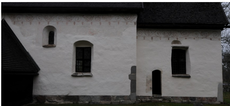
Vederslövs gamla kyrka, sydsidan efter konservering och restaurering.

Konservering och restaurering av exteriör dekorationsmålning - akantusslinga från 1682.