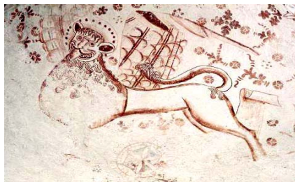
Båstads kyrka. Detalj i södra vapenhuset.

Konsivering av målningar 1500-1525 i norra sidoskeppet och södra vapenhuset.