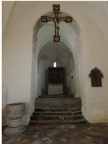
Hemmesjö Gamla kyrka.

Konsivering av fragmentariskt bevarade romanska målningar 1175-1200 i absid, kor och triumfbåge.