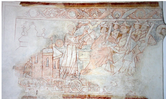
Åhus kyrka. Detalj av långhusets nordvägg.

Konsivering av tidig gotiska målningar från 1275-1300 i kor och långskepp.