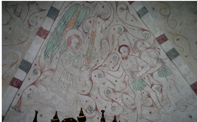
Nymö kyrka. Östra långskeppsvalvets södra valvkappa.

Konsivering av målningar i två långskeppsvalv och fragment i vapenhus.