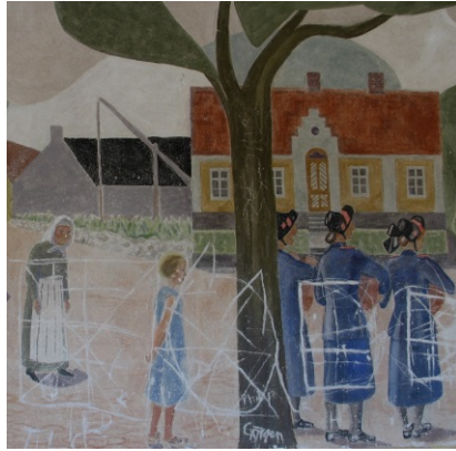
Rönnowskolan. Detalj före restaurering