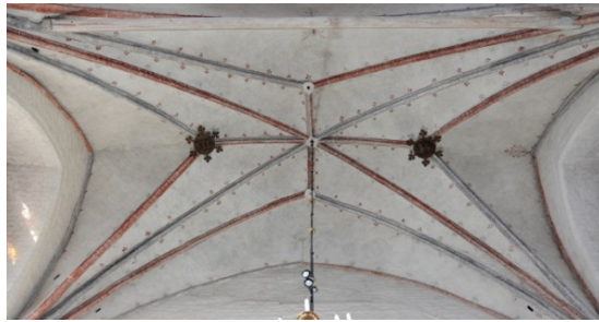
Skanörs kyrka. Västra korvalvet.

Konsivering av korvalvens ornamentala dekoration från 1400-talet.