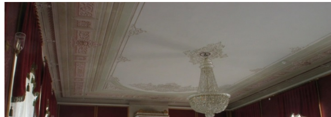
Bäckaskog. Röda salongens tak.

Konsivering av dekorationsmålningen i Röda salongen. 1800-talets mitt. Uppdragsgivare Statens Fastighetsverk.