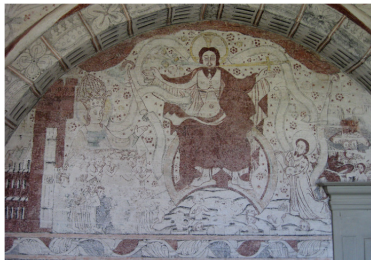
Maglehems kyrka, korets nordvägg

Konsivering av målningar av hög autenticitet i kor och långhus.