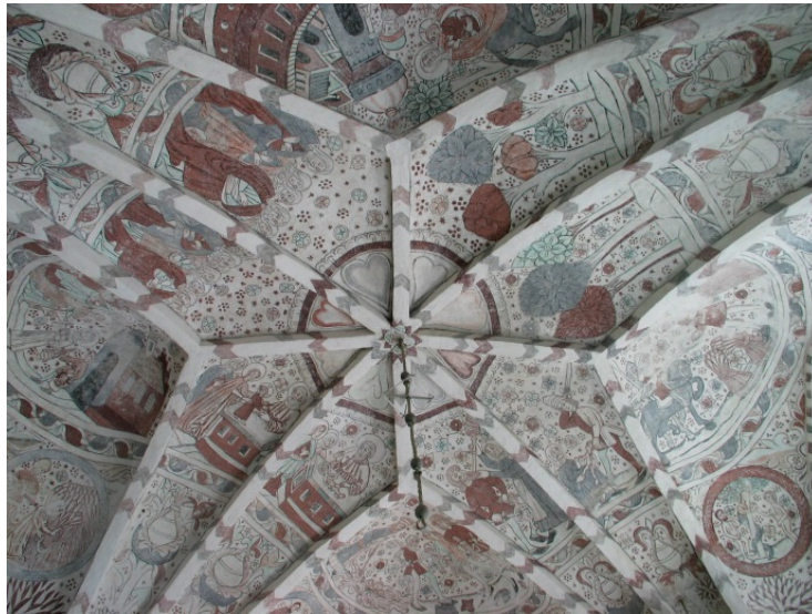
Norra Strö kyrka, östra långhusvalvet.

Konsivering av fullkomligt autentiska målningar i tre valv.