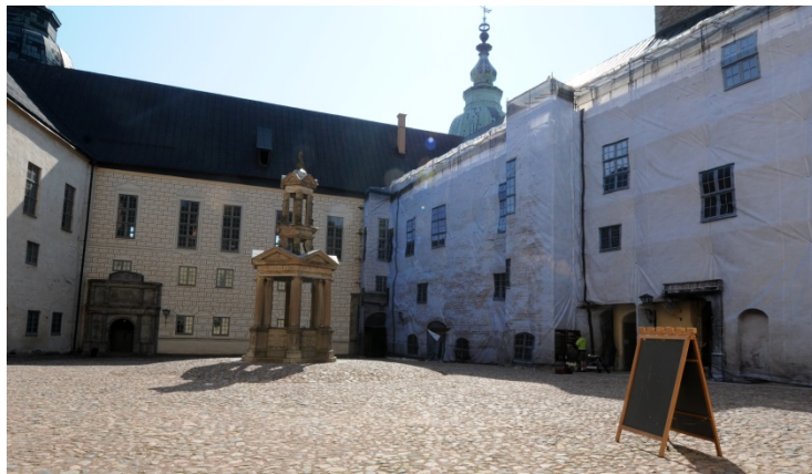
Kalmar slott, inre borggården. Under arbetet med målning av västra fasaden 2013.

Konservering av originalputsens och rekonstruktion av dekorationsmålningen från ca 1580 på inre borggårdens västra fasad. Uppdragsgivare Statens Fastighetsverk.