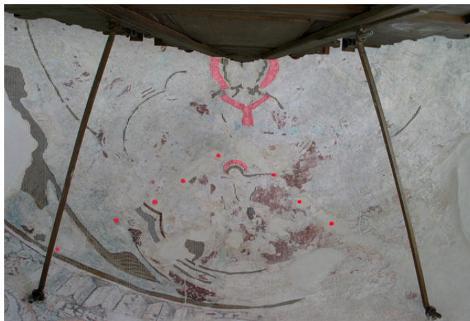
Norra Strö kyrka. Dokumentation av tidigare okända romanska fragment framställande nådastolen inramnad av fyrpass. Rosa skraffering stuckglorior och ornamentalt pallium. Svart skraffering bl.a. fyrpasset och delar av Markus-symbolen. Rik stuckrelief av denna typ hör i allmänhet till perioden 1150-75.

Konsivering av romanska fragment i absid. Vid arbetet upptäcktes att i absiden har funnits en romansk treenighetsframställning.