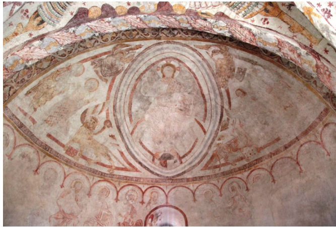
Hästveda kyrka. Absidens Majestas Domini.

Konsivering av senromanska målningar från 1225-50 i absid och triumfbåge samt över valv vid triumfbågsväggen.