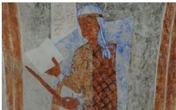
Gualövs kyrka. Detalj med kvinnlig donator.

Konsivering av romanska målningar 1125-50 i triumfbåge. Målningar med mycket hög grad av autenticitet.