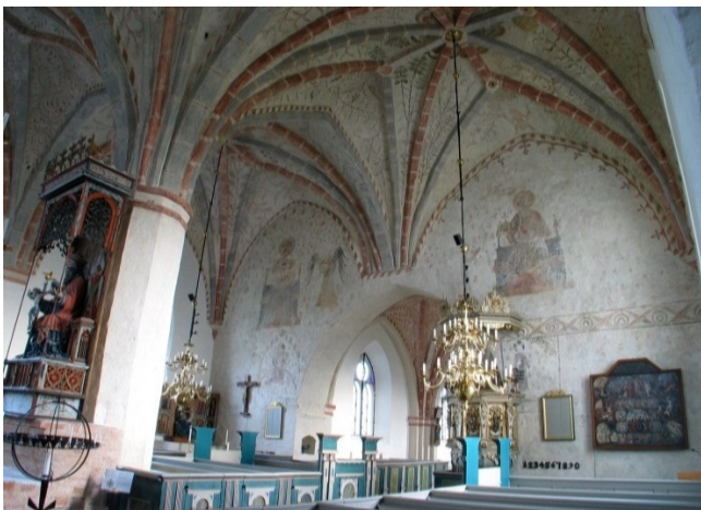
Sankt Olofs kyrka, långhusets östparti.

Konservering av målningar från 1400-1425. Åtta valv och triumfvägg.