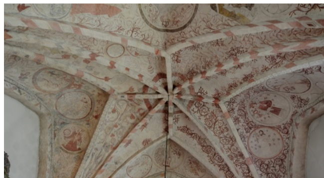
Knislinge kyrka. Långskeppets västra stjärnvalv.