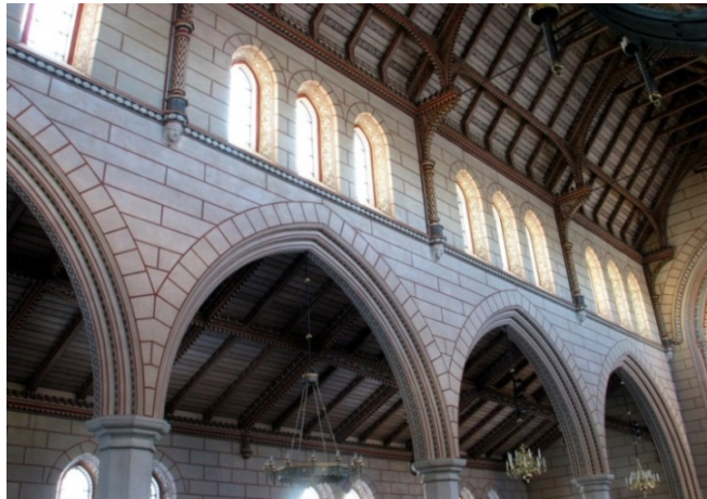
Hyby kyrka. Mittskeppets södra sida.

Konsivering och restaurering av hela den interiöra dekorationsmålningen från 1877.