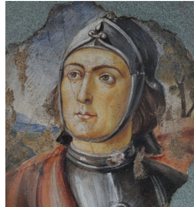
Domenico Ghirlandaio: Detalj av en av freskerna tillhörande Lunds Universitets konstsamling.