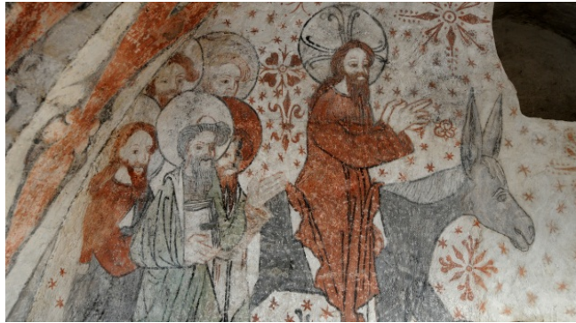
Ysane kyrka. Detalj från korets östvägg.