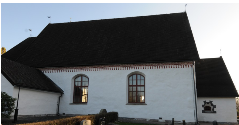
Alvesta kyrka sedd från norr.

Rekonstruktion av exteriör dekorationsmålning från 15-1600-talet.