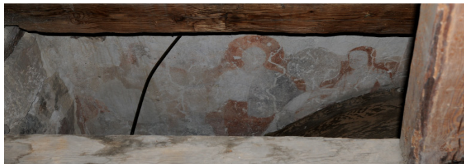
Knislinge kyrka. Del av romanska målningar över valv.

Projektering för konserveringsteknisk förundersökning av romanska målningar från ca 1200 på triumfvägg och korväggar. Målningar placerade över kyrkans 1400-talsvalv.