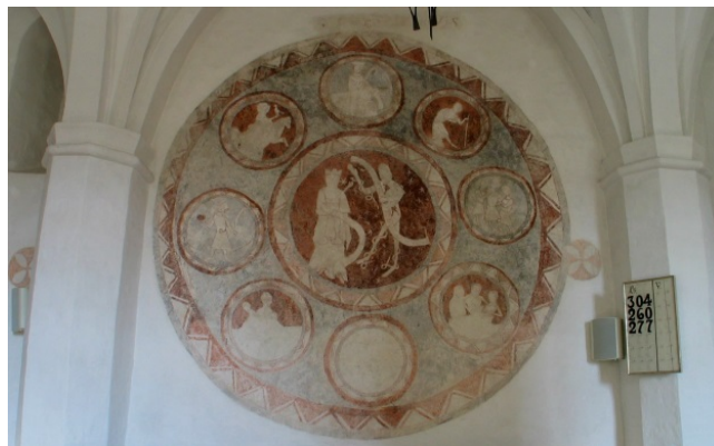
Norra Mellby kyrka. Mementum mori.

Konsivering av tidiggotisk målning "mementum mori" från ca 1275.