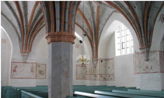
Fru Alstads kyrka. Långhusvalvens mittpelare i bildens framkant och sidoskeppets bildframställningar i fonden.

Bildframställningar i sidoskepp och ornamentala dekorationer i sex valv.