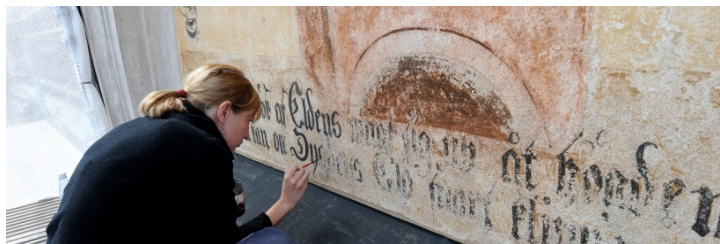
Smithska huset. Detalj under retuschering med kaseitempera.