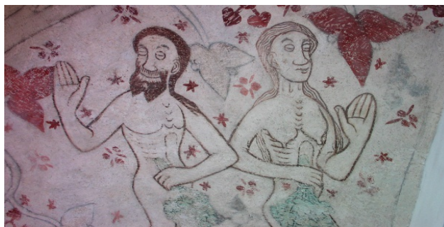
Rinkaby kyrka. Detalj från östra långskeppsvalvet.