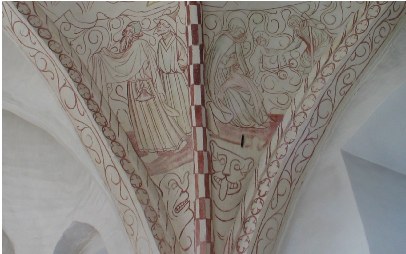
Brönnestads kyrka. Västra långhusvalvets nordvästra svickel med målningar av optimal autenticitet.

Anställd av konservator Våga Lindell Andersson.