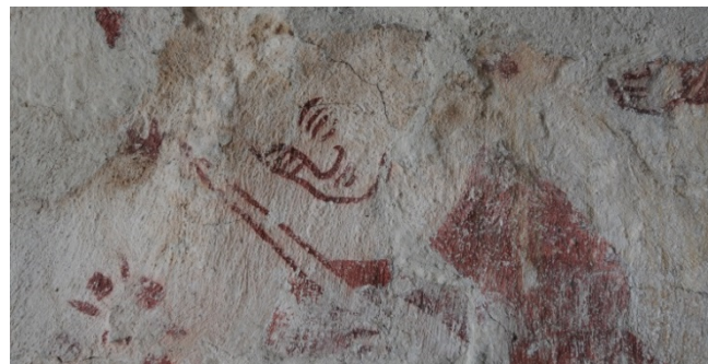
Fjälkestads kyrka. Detalj.

Konsivering och kompletterande friläggning i fragment. Genom arbetet säkerställdes tidigare osäker attribuering till Vittskövleverkstaden.