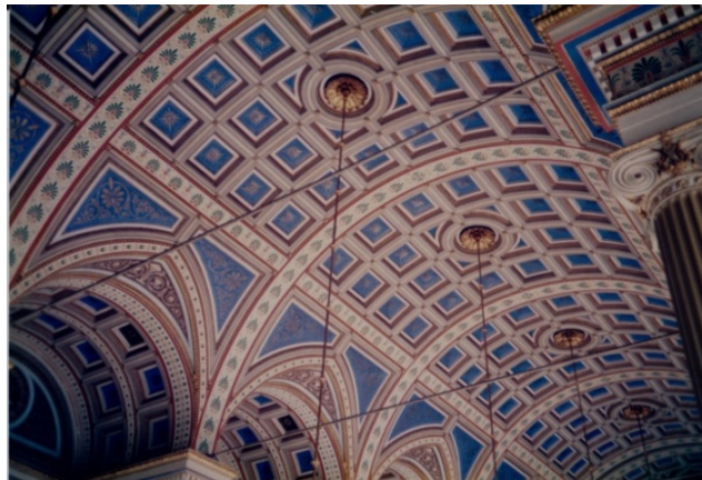
Universitetshuset i Lund. Parti av takdekorationen.

Konsivering av Svante Thulins dekorationsmålningar i universitetsaulan från 1882.