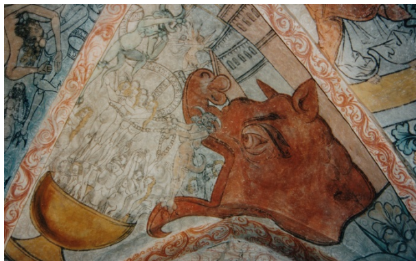
Hjärsås kyrka. Framställning av Leviatan i koret.

1996 Hjärsås kyrka Konservering av målningar från 1525-1550 i absid och kor och konservering av exteriöra ornamentala kalkmålningar från 1500-1600-talet.